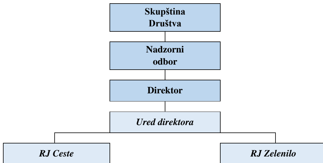
Tablica br. 1.: Shema organizacijske strukture Društva

Na početku 2024. je u Društvu bio zaposlen 31 radnik uključujući i direktora Društva. Tijekom godine radi potreba poslovanja zaposlen je još jedan radnik na slobodnom radnom mjestu traktorista, tako da je na kraju 2024. u Društvu bilo zaposleno ukupno 32 radnika.