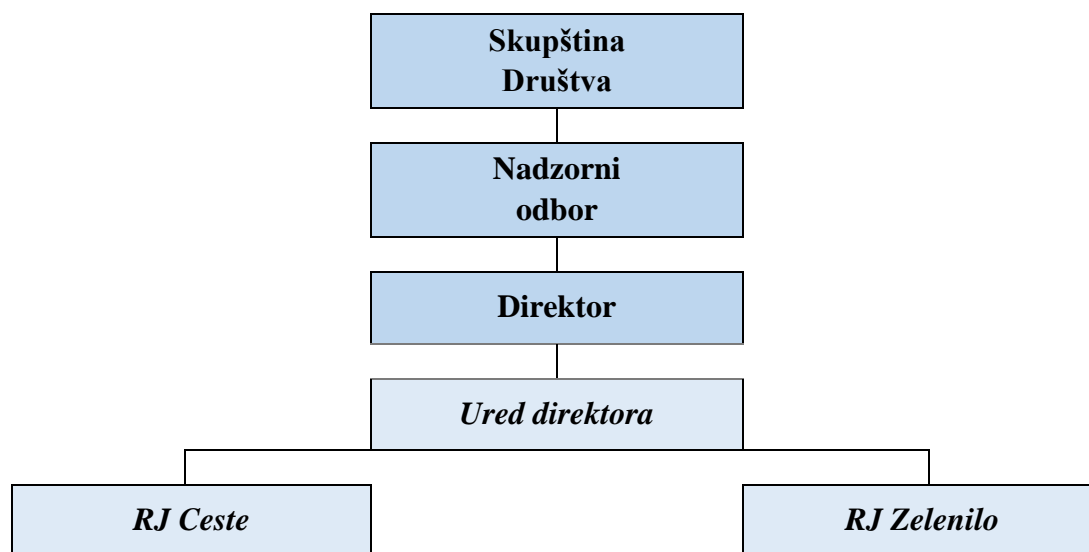
Tablica br. 1.: Shema organizacijske strukture Društva

Na početku 2023. je u Društvu bilo zaposleno 29 radnika uključujući i direktora Društva. Tijekom godine radi povećanog intenziteta poslovanja zaposlen je još jedan radnik na slobodnom radnom mjestu hortikulturnog radnika, tako da je na kraju 2023. u Društvu bilo zaposleno ukupno 30 radnika.