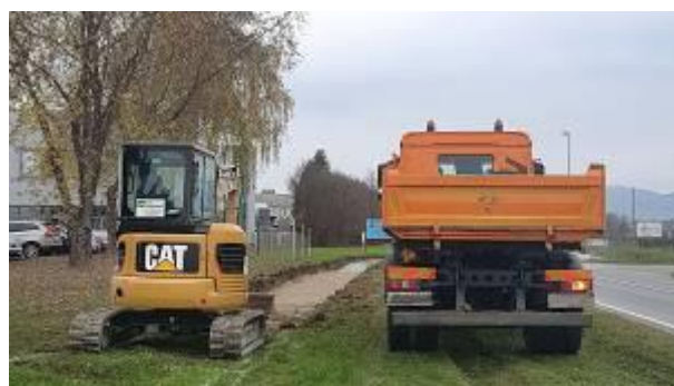
Radovi u Cvetkoviću, Dragovanščaku, Južnoj zoni i GZ »Jalšovec«